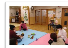
おひさまサークル