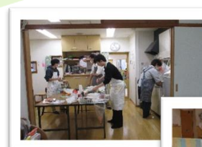
パパと一緒にタイム