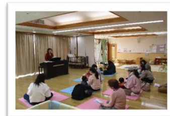
秋の音楽を感じよう