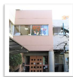
センターは2階です。

社会福祉法人二葉保育園 二葉乳児院併設 地域子育て支援センター二葉 〒160-0012 東京都新宿区南元町4 TEL 03-5363-2170 FAX 03-3359-4596 HP http://www.futaba-yuka.or.jp/int_nyu/hutaba/