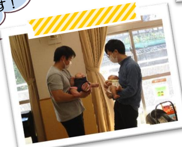
パパと一緒に遊ぶタイム