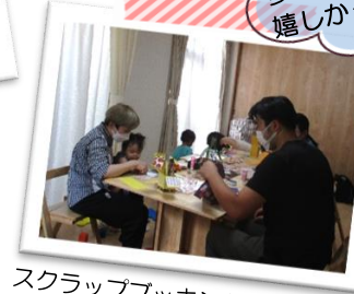
スクラップブック体験