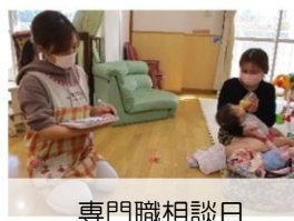
専門職相談日 気軽に相談できます